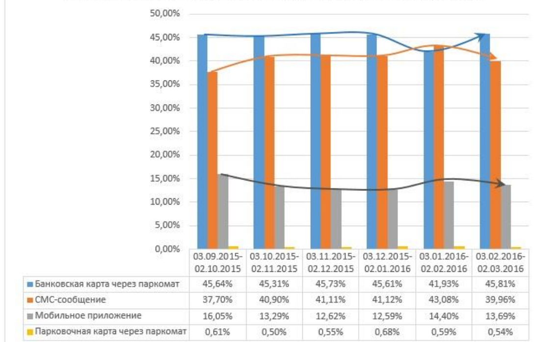
Динамика пользования предоставленными способами оплаты парковки

Что касается доходной части реализации проекта, то она составила 63 млн 505 тыс. 115 рублей. Из них 2 млн 545 тыс. 200 рублей были получены за оформление парковочных разрешений жителей, а также месячных и годовых парковочных разрешений до рассматриваемого периода, с 03.08.2015г. по 02.09.2015г.